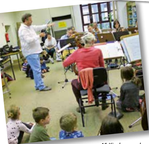
15 Kinder aus dem Kinderhaus Brötzingen und 8 Kinder aus der Kindertages- stätte Pforzheim besuchten am 15. Mai 2018 eine Probe des Südwestdeutschen Kammerorchesters Pforzheim für „Telemania“.