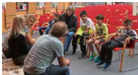
Kinderreporter interviewten am 16. Mai 2018 das Ensemble Quadro Nuevo.