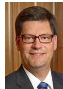
Julian Osswald Oberbürgermeister Stadt Freudenstadt Vorsitzender des Verwaltungsrates Schwarzwald Musikfestival

Das Schwarzwald Musikfestival macht den Menschen die Vorzüge einer großen Bandbreite zugänglich und ermöglicht es, musikalische Inspiration für sich persönlich zu entdecken. Ohne die große Unterstützung von vielen Seiten wäre diese programmatisch und konzeptionell erfrischende wie anspruchsvolle Realisierung nicht möglich. Ich danke unseren Premiumpartnern, dem Festivalintendanten Mark Mast, dem Land Baden-Württemberg sowie allen Partnern, Förderern und Unterstützern für die langjährige, vertrauensvolle Zusammenarbeit. Ich freue mich, Sie beim Schwarzwald Musikfestival willkommen heißen zu dürfen.