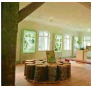
Kulturpark Glashütte Biersbronn-Buhlbach Schliffkopfstraße 46, 72270 Biersbronn-Buhlbach www.biersbronn.de/glashuette

In Biersbronn-Buhlbach befand sich vom 18. – 19. Jahrhundert die größte und bedeutendste Glashütte des Schwarzwaldes. Was heute kaum jemand mehr weiß: Der weltweite Erfolg von Buhlbach liegt in der Entwicklung der druckfesten Champagnerflasche begründet. Zwei Millionen Flaschen wurden einst jährlich mundgeblasen in alle Welt exportiert. Die heute noch stehenden Gebäude sind die letzten historischen Glashüttengebäude im Schwarzwald. Die musikalische-literarische Performance findet im neu verglasten Schuppen auf dem Gelände des Kulturparks statt. Ab 18.00 Uhr wird eine Führung für Interessierte über die Schwarzwälder Glasherstellung sowie die Historie der Glashütte Buhlbach angeboten.