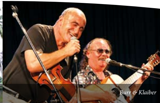
Burr & Klaiber