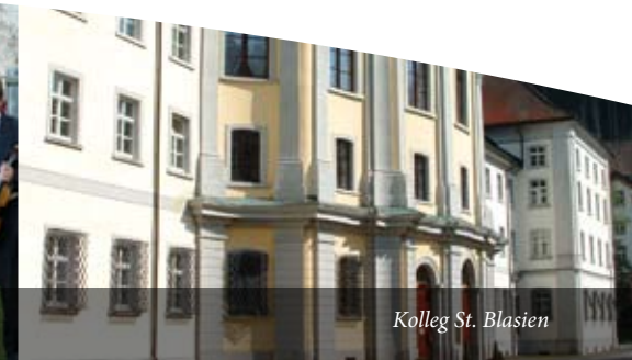
Kolleg St. Blasien