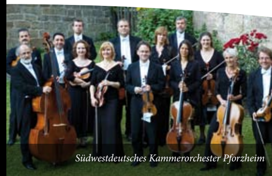
Südwestdeutsches Kammerorchester Pforzheim