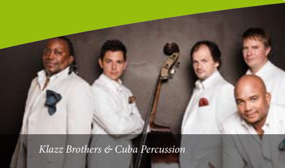
Klazz Brothers & Cuba Percussion

Konzertpate: Kreissparkasse Freudenstadt