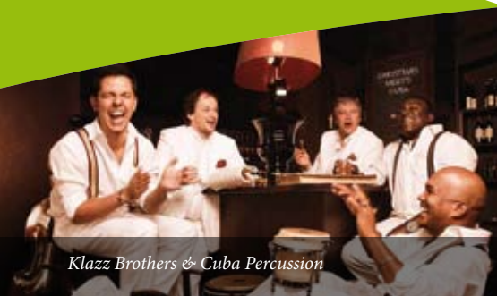
Klazz Brothers & Cuba Percussion

Konzertpate: Wirtverein Hinterzarten/ Breitnau e.V.